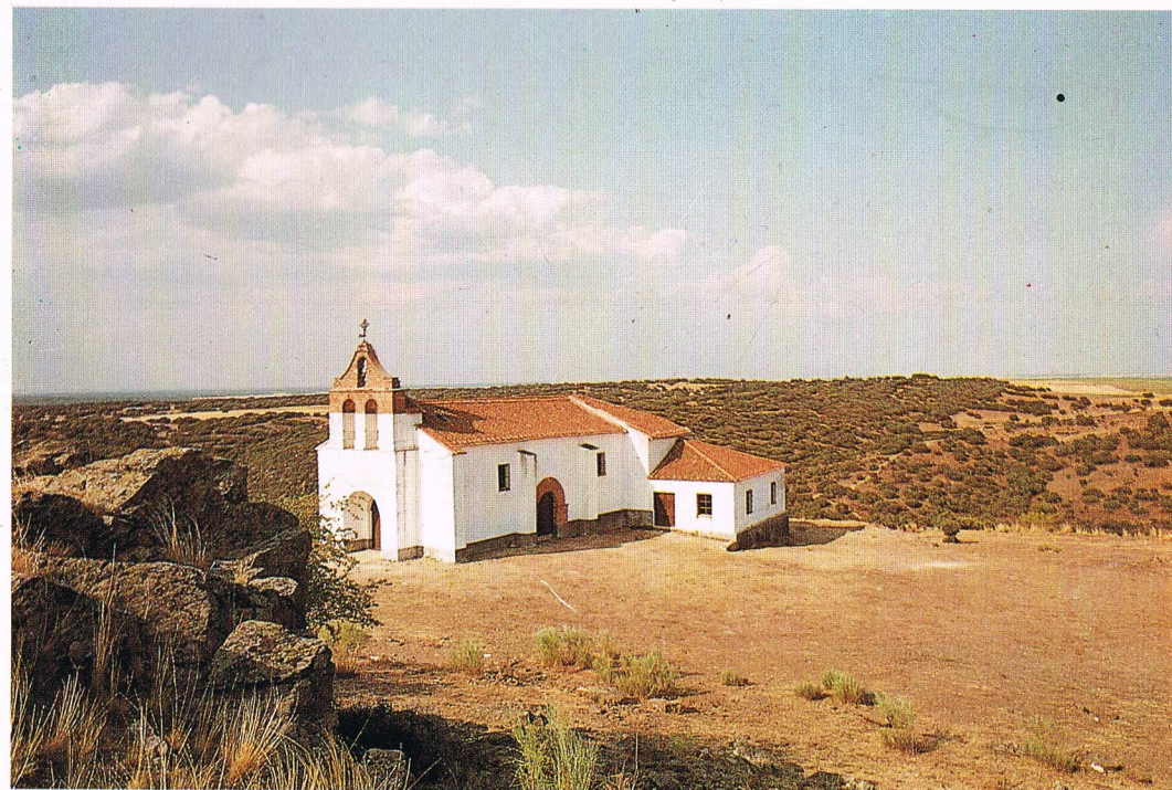
Ermita del Castillo